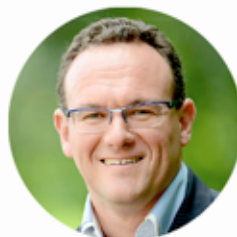
DAMIEN ABAD Député et Président du département de l'Ain